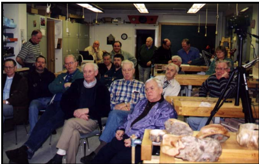
Áhugasamir félagsmenn á fundi í Skipholtinu. Ert þú þarna?