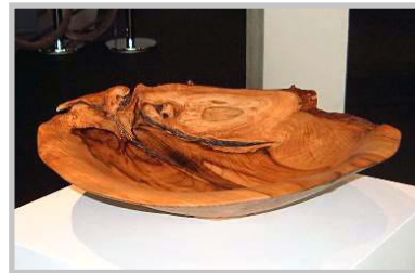
Skál eftir Jón Guðmundsson